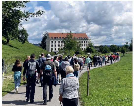
Der Ettiswiler Auffahrtsumritt auf dem Weg nach Alberswil.