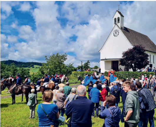
Festpredigt bei der Antoniuskapelle in Stettenbach.

Es sind alle eingeladen, die Prozessionsteilnehmenden am Strassenrand in Empfang zu nehmen.