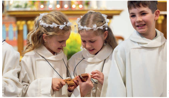
Bilder: Martina Aregger