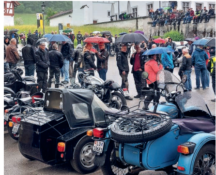
Verregnet: an der Töffsegnung vom vergangenen Jahr in Altishofen.

Töffsegnungen sind für die Freund:innen der motorisierten Fortbewegung auf zwei Rädern Fixpunkte zur Saisoneroöffnung. Im Kanton Luzern gibt es jeweils zwei solche Feiern, in Altishofen und Aesch.