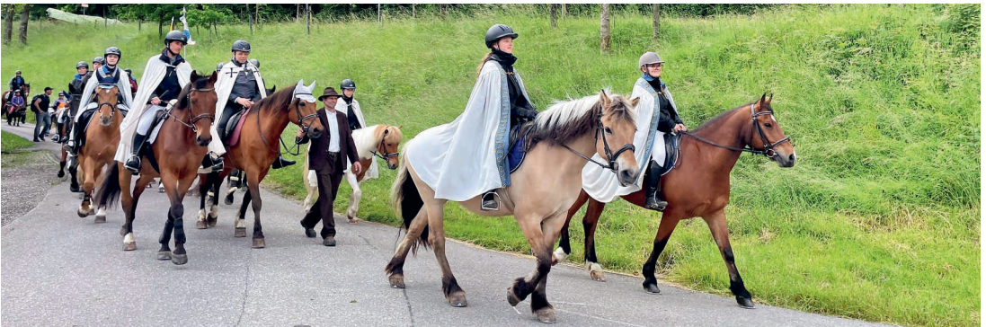
Hoch zu Pferd – unterwegs am Umritt in Ettiswil.