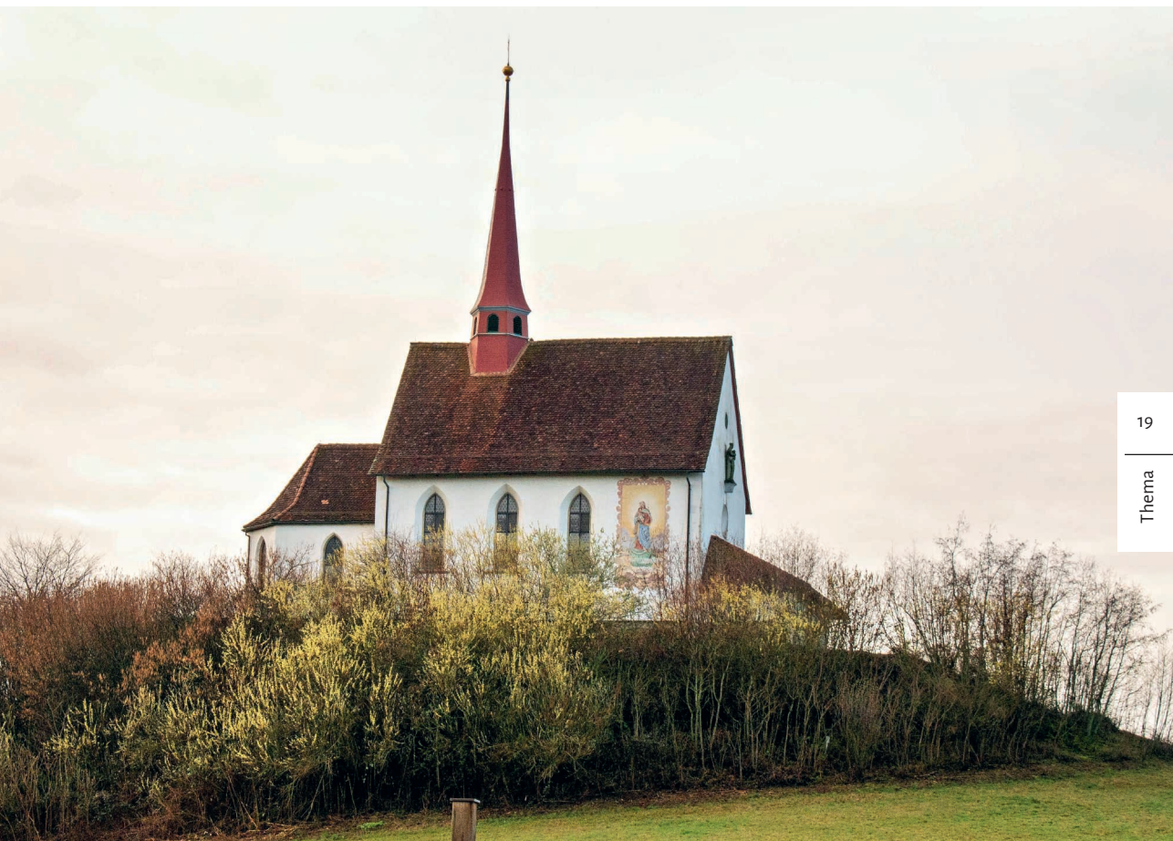
Die Wallfahrtskapelle Gormund liegt auf einem Moränenhügel und ist von Weitem sichtbar.