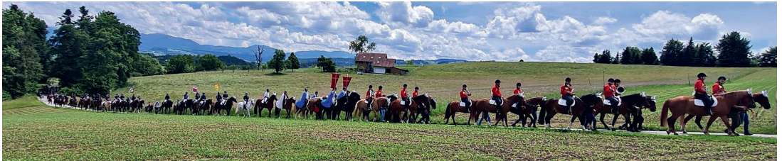
Gemeinsam auf dem Weg in Grosswangen.

Wenn an Auffahrt die Natur in voller Blüte steht, ziehen Reiterinnen und Reiter gemeinsam mit dem Fussvolk durch unsere Pfarreien Grosswangen und Ettiswil. Die Auffahrtsumritte verbinden gelebte Traditionen mit der Freude an Pferd, Gemeinschaft und der erwachenden Frühlingslandschaft.