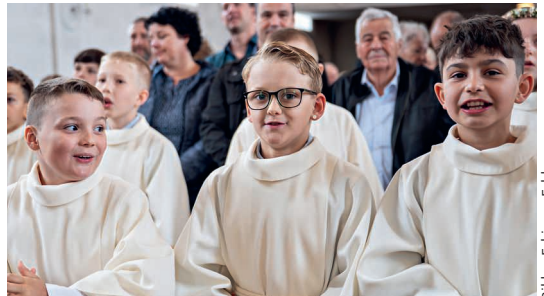
Bilder: Fabienne Felder